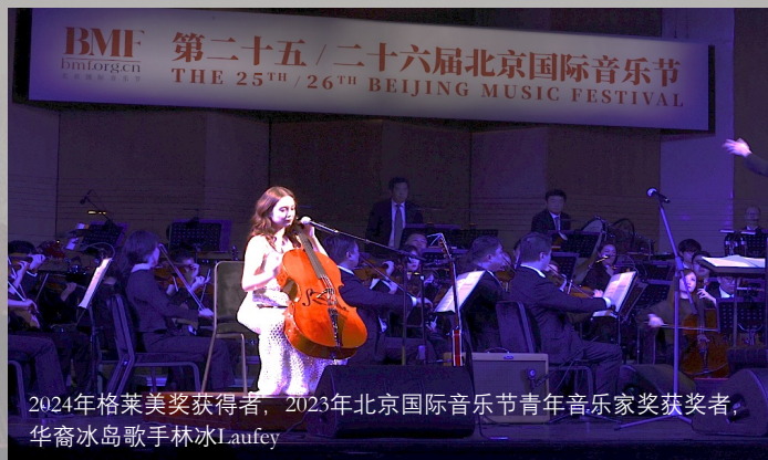
2024年格莱美奖获得者，2023年北京国际音乐节青年音乐家奖获奖者，华裔冰岛歌手林冰 Laufey